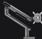
KDS 悬臂支架 (来自第三方品牌)