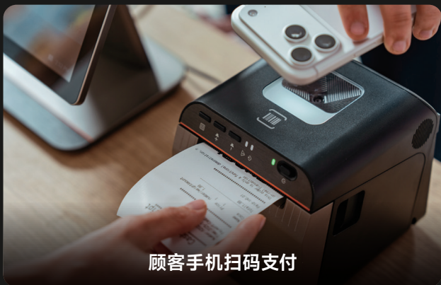
顾客手机扫码支付

可选配扫码模块，轻松实现扫码+打印一体化解决方案。 高效专业扫码头，支持多场景扫码应用，适配商品录入、扫码支付与核销出库全流程需求。