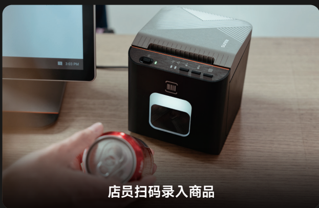
店员扫码录入商品